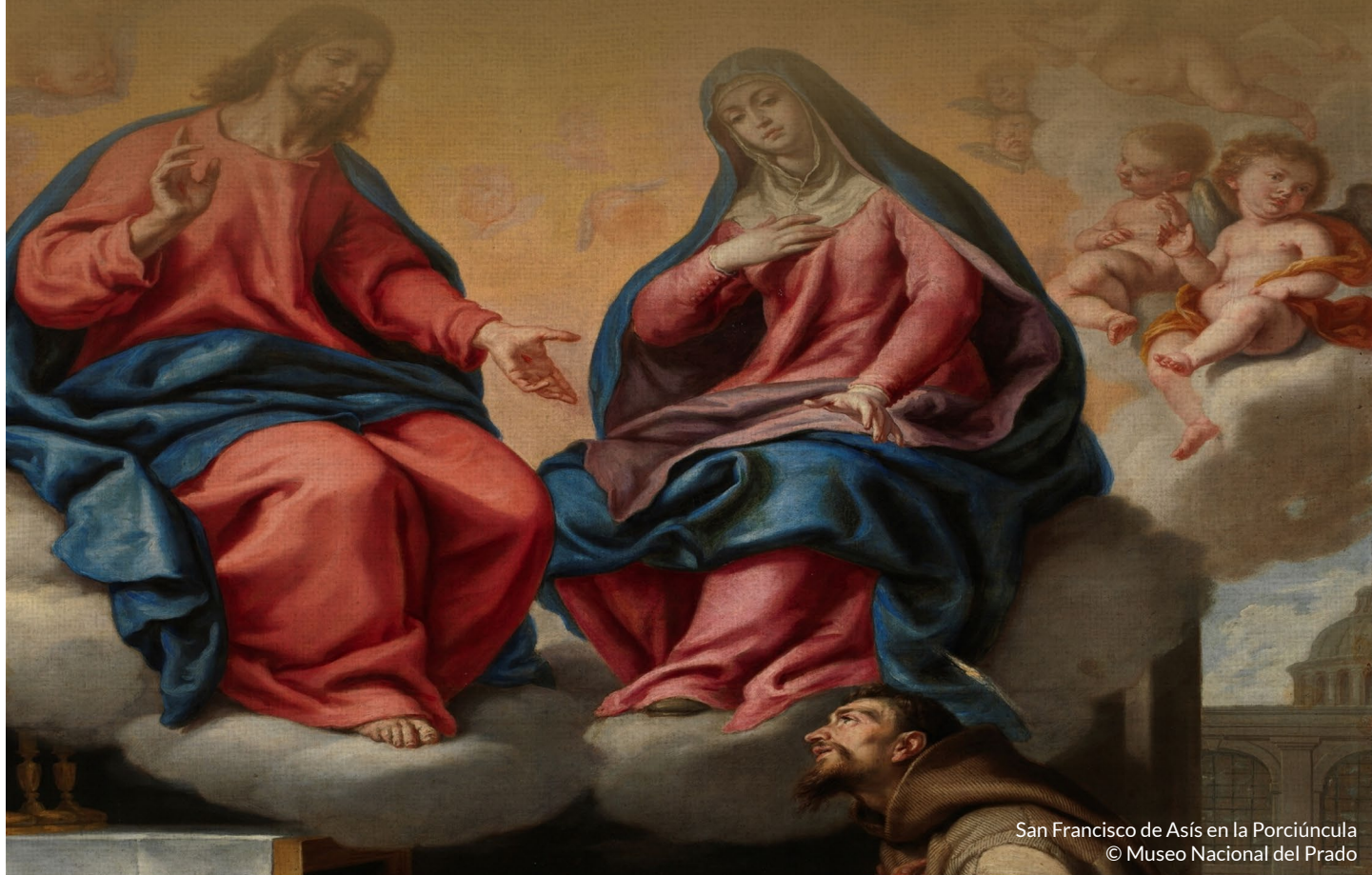
San Francisco de Asís en la Porciúncula © Museo Nacional del Prado

October 3, 2021 • 27 th Sunday in Ordinary Time