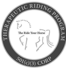
B&B Stables Rideyourhorsecerritos.com