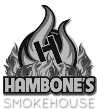
Hambones Bar & Grill Hambonesbarandgrill.com