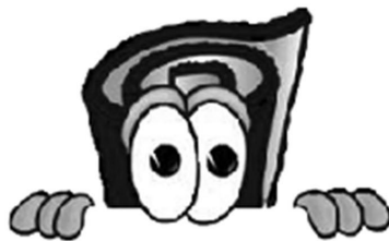
Eternity Carpet EternityCarpet.com