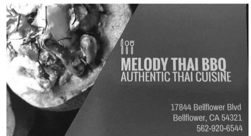
Melody Thai BBQ 562-920-6544