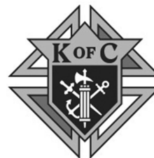
Knights of Columbus® Knights of Columbus, Council 3052 (562) 866-9105